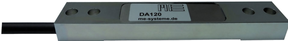
Abbildung 3: Dehnungsaufnehmer DA120, DA120e, DA120i