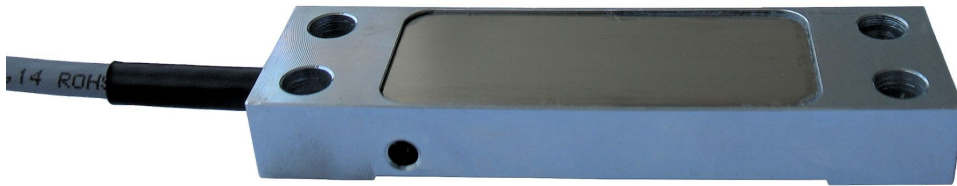
Abbildung 2: Dehnungsaufnehmer DA90, DA90e, DA90i