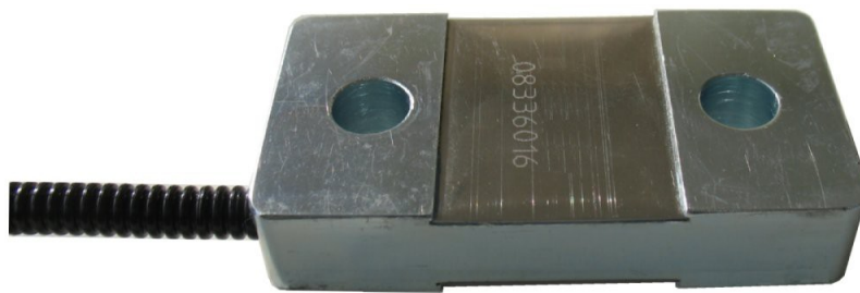
Abbildung 1: Dehnungsaufnehmer DA70

Die Dehnungsaufnehmer DA90i und DA120i enthalten eine integrierte Auswerteelektronik GSV-6L, die komplett skalierbar und einstellbar ist. Die Konfiguration erfolgt über zwei Steuerleitungen "Tara" und "Scale". Die ausführliche Erklärung der Konfiguration findet man in der Bedienungsanleitung „ClickRClackR“.